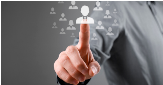
Máster en Corporate Compliance de Economist Innovative School

En conclusión, sí se puede decir que una persona jurídica tenga intimidad, en cierto modo, y sí se le pueden dar herramientas para protegerla. Esto es relevante tanto desde el punto de vista de la Protección de Datos como del Compliance, dado que no sólo deberá aplicar las medidas que dispone el Reglamento General de Protección de Datos con especial rigor, sino que deberá tener medidas de Compliance penal adecuadas para evitar descubrir o divulgar informaciones “sensibles” de otras empresas con las que se contrate.