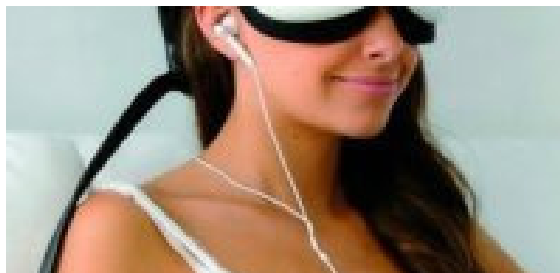
Un método increíble de aprender inglés e idiomas está conquistando España. Compruebe ahora